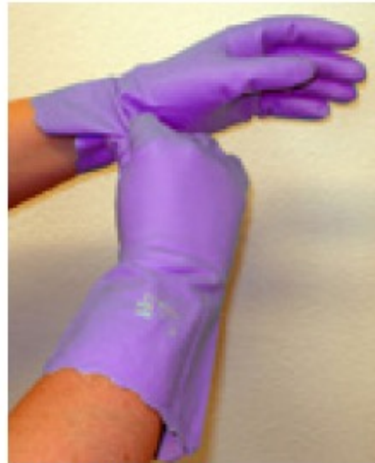
Saisir le gant de l'extérieur