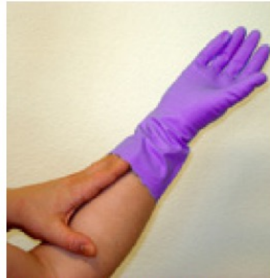
Saisir le gant de l'intérieur